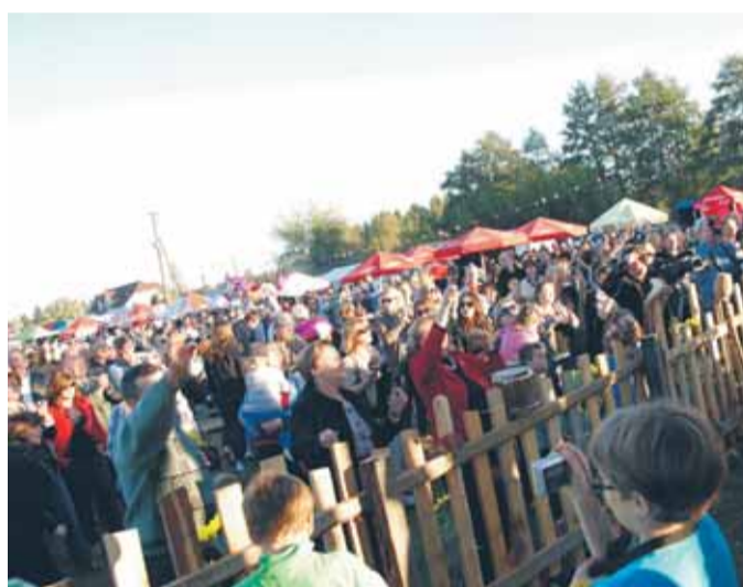
Ciekawy program estradowy przyciągał widzów