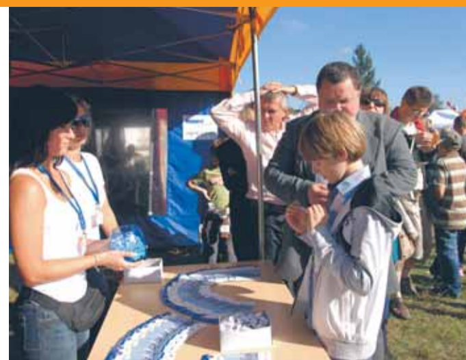
Stoisko promocyjne Urzędu Gminy obfitowało w atrakcje