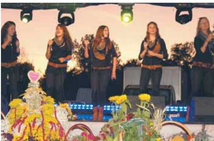
ToBeUp spowodował tłok przed estradą