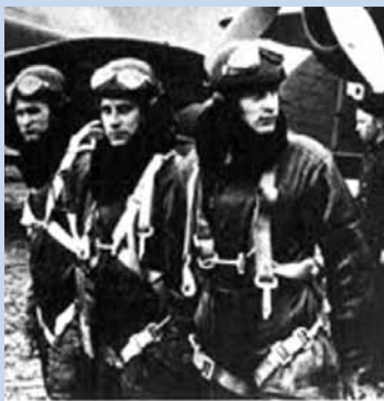
Załoga polskiego „Łosia”