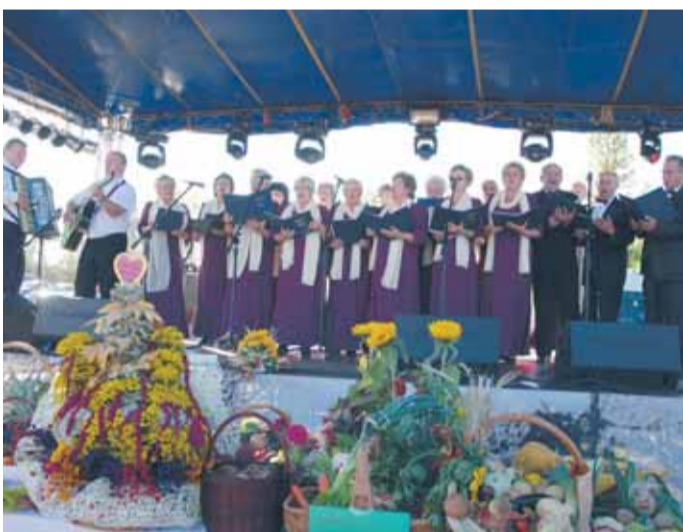
Wystąpił zespół Młodzież 50+ ze Stanisławowa Drugiego