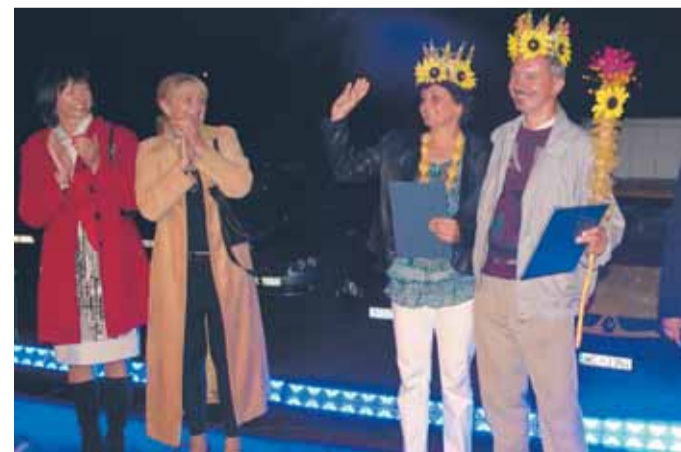
A oto Królowa i Król Ziemiaka 2011