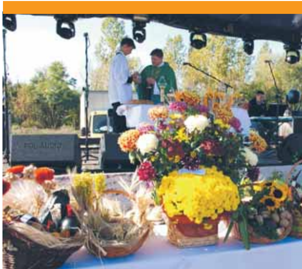
Dożynkowe dary ustawione zostały przed ołtarzem