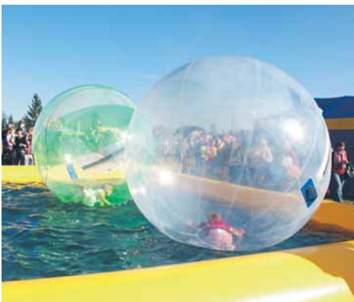
Pływające kule były prawdziwą atrakcją festynu