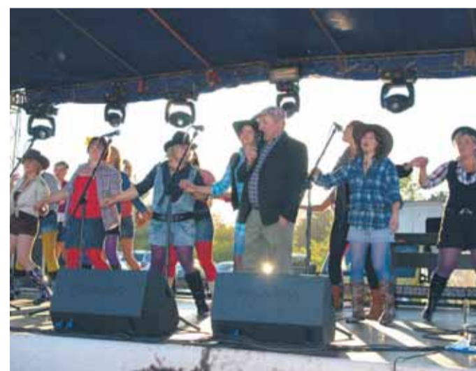
Józejkinki z sołtysiem Józefowa bawiły publiczność