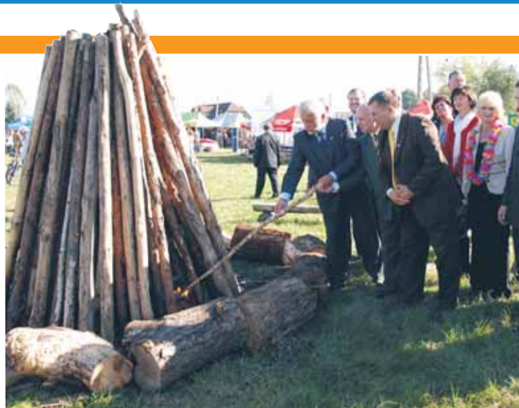
Wspólne rozpalenie dożynkowego ogniska