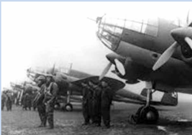
Załoga „Łosia” przed wylotem na zadanie bojowe