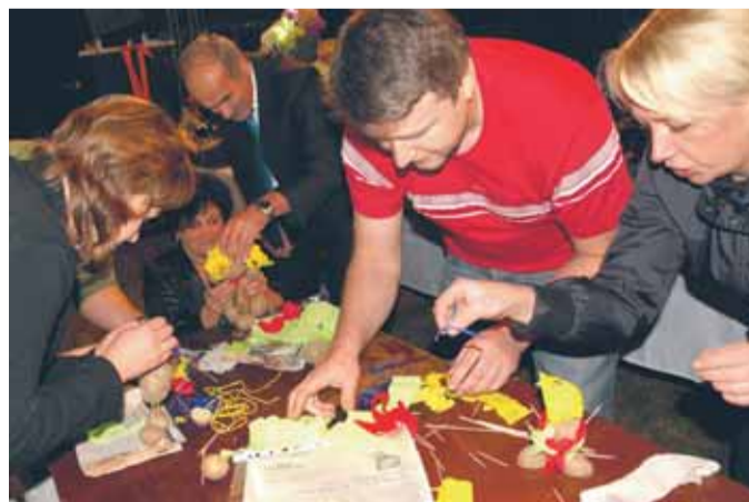
Zdolności plastyczne przydały się w walce o tytuł Królowej i Króla Ziemiaka